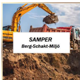
Per Samuelsson Samper Consulting AB