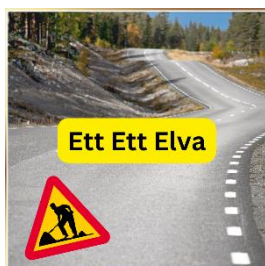
Leif Malmenlid Ett Ett Elva